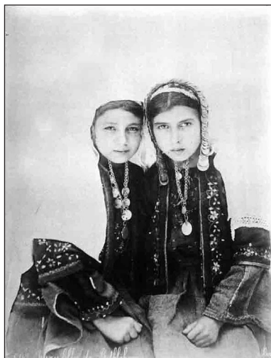
Två palestinska flickor från Betlehem

Ironin – ja, den första och största ironin – är att Ben-Gurion under sin forskning om Palestinas historia på New Yorks offentliga bibliotek 1916 kom fram till att det var de palestinska bönderna som var de gamla hebréernas verkliga ättlingar. (84)